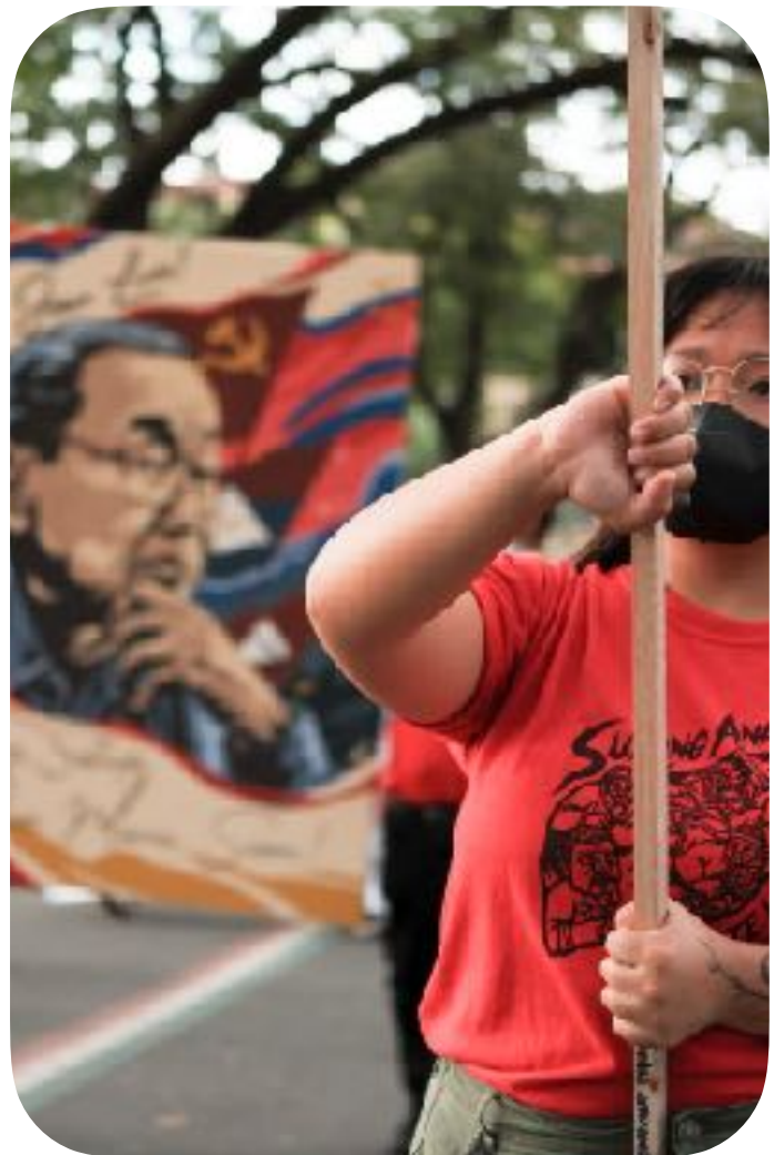
Martsa ng mga organisasyong masa sa loob ng UP-Diliman bilang parangal kay Ka Joma, Disyembre 19, 2022

Kapag ang nakakampong kaaway ay napagod at umatras, BHB naman ang aabante at magdadala ng mas opensibang pagbira. Pero habang mistulang nakalalamang ang kaaway sa pag-abante at pagkampo, ang pwersa ng BHB na taktikal na umatras sa isang larangang gerilya ay maaaring maglunsad ng mga taktikal na opensiba na kaya nitong pagtagumpayan sa mga kalapit na lugar. Pinakamasama para sa kaaway, katulad ng karaniwang nangyayari, sa maraming larangang gerilya sa isang rehiyon at sa lahat ng iba pang rehiyon, pwedeng kunin ng BHB ang inisyatiba sa